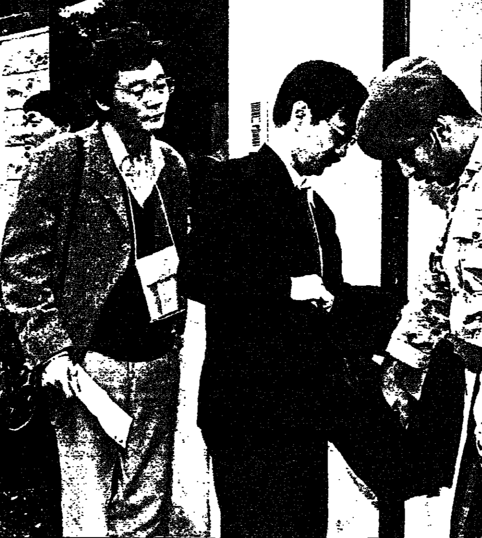
شريط لبناني ينتش حقيبة احد الصحافيين اليبانيين قبل تفريغها سفارة طوكيو في بيروت

وزير الداخلية اللبناني يؤكد ان اجهزته لم توقف احدا من عناصر الجيش الاحمر اللبناني: غموض تام وسط تكتم السلطات اللبنانية